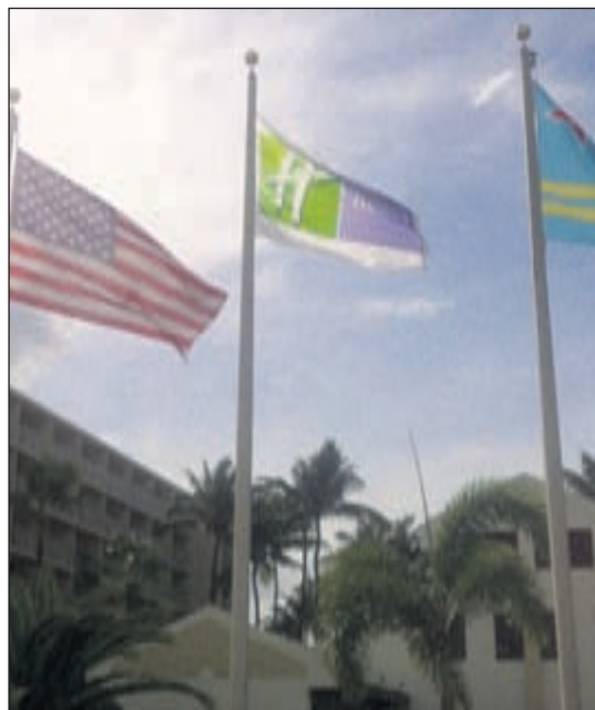
Empleado y hasta huespednan a comparti momento cu bandera nobo a bay halto